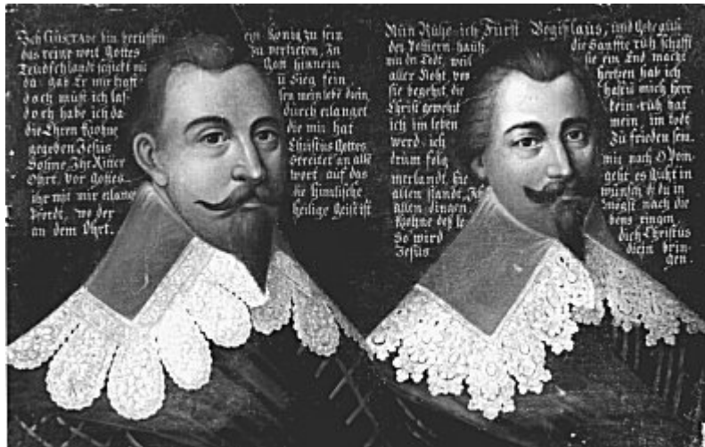
König Gustav Adolf und Herzog Bogislaw XIV.

1635 gewannen die kaiserlichen Truppen wieder die Oberhand, zu dieser Zeit standen 9000 Mann schwedischer Truppen in 13 Städten in Pommern in Garnison. Am 7. Oktober 1635 wurde Stargard ein Raub der Flammen und von den Kaiserlichen Truppen wieder eingenommen. Nach dem schwedischen Sieg bei Wittstock am 14. September 1636 hatten die Schweden im Norden wieder die Übermacht, es gelang ihnen, die Kaiserlichen aus Pommern zu vertreiben. Nach dem Tod von Bogislaw XIV. am 10. März 1637 wurde Pommern wie eine schwedische Provinz behandelt. Das Kurfürstentum Brandenburg konnte keine Ansprüche auf Pommern durchsetzen. Häufige brandenburgische Einfälle in den Jahren 1639 und 1640 verschlimmerten die Lage der Bevölkerung. Ende 1641 einigte man sich, einen Friedenskongress in Münster und Osnabrück einzuberufen. Der Westfälische Friede wurde erst 1648 erreicht. Der brandenburgische Kurfürst Friedrich Wilhelm (Der Große Kurfürst) hat sich vergeblich bemüht, eine Teilung Pommerns zu verhindern. Er musste Vorpommern mit Rügen und von Hinterpommern Gartz, Stettin, Damm, Gollnow und die Insel Wollin, wie auch die Oder mit ihren 3 Mündungsarmen und dem Haff an Schweden abtreten. Pommern hatte seine Selbständigkeit endgültig verloren. Hinterpommern war nun eine brandenburgische Provinz. Einen genauen Ablauf des Dreißigjährigen Krieges in Pommern findet man in dem 1904 erschienenen Buch "Geschichte von Pommern" von Martin Wehrmann. 1982 gab es eine Neuauflage.